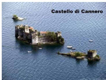
Castello di Cannero