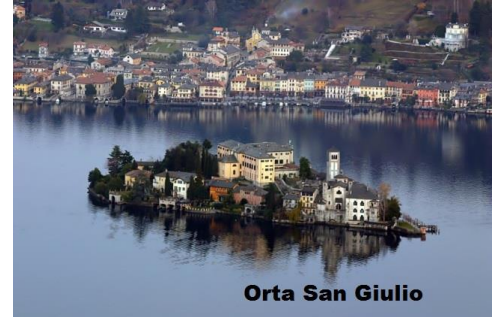
Orta San Giulio