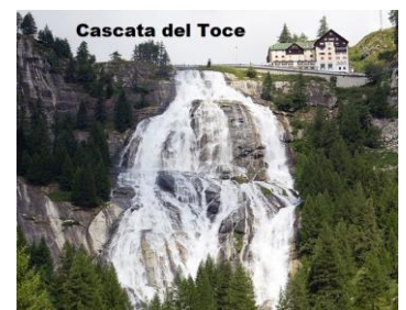
Cascata del Toce

- Raggiungere la zona del Monte Rosa fino a